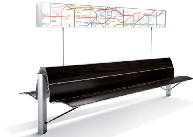
esempio di applicazione di totem luminoso orizzontale

ACCESSORI Il sistema prevede una gamma di accessori per assolvere a diverse funzioni: arredare, illuminare, contenere, informare attraverso piani d'appoggio, corpi illuminanti ed elementi di servizio.