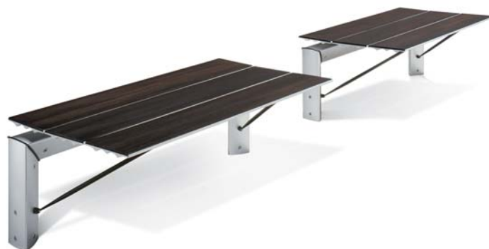
esempio di panchina con fissaggio a pavimento

INSTALLAZIONE Per il fissaggio delle panchine al suolo viene fornito un accessorio predisposto per l'applicazione con l'ancorante chimico (naturalmente prima di eseguire la suddetta operazione andrà valutato il tipo di pavimentazione presente in loco - le opere edili sono escluse). Nel caso di panchine mobili saranno forniti i rispettivi piedi di sostegno (optional).