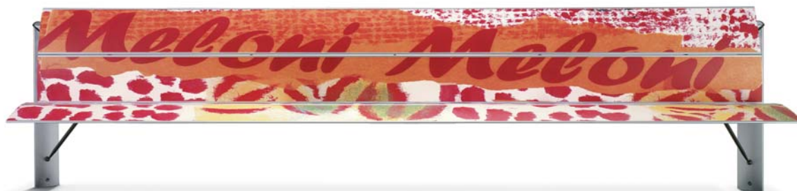
esempio di applicazione di pannelli plastici in forex personalizzati

Accessori (piedi e staffe): bronzo gofrato.