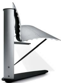
es. versione singola con schienale