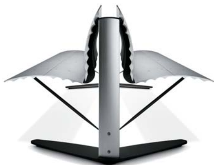
es. versione doppia con schienale

PESO Dai 45 kg della panca singola L 1200 ai 290 kg della panca doppia L 6000